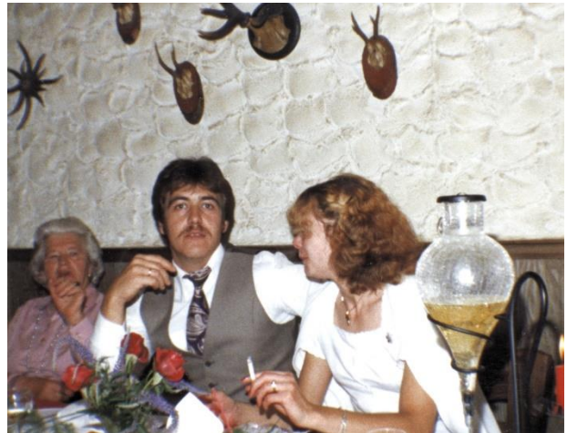
(Bild: privat Löw, 1981 standesamtliche Hochzeit – keiner muss hungern!)