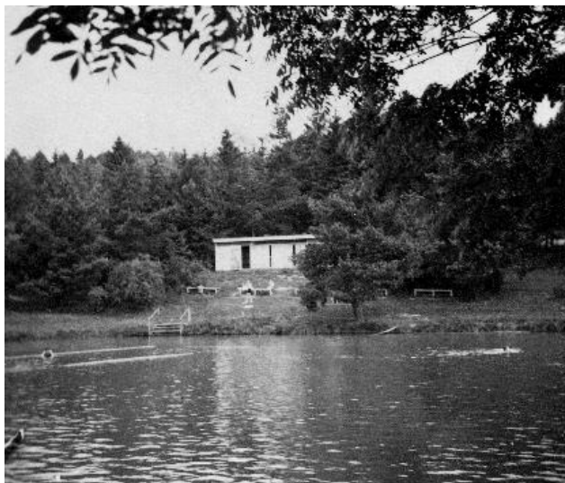
1948, der Unterwasserholzboden schwemmt auf