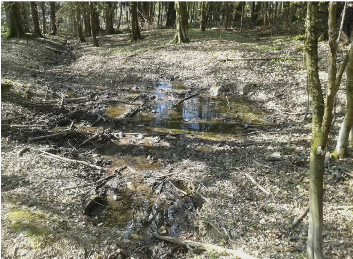
(Eschbach Quelle mit Suhl Grube für die Wildschweine)