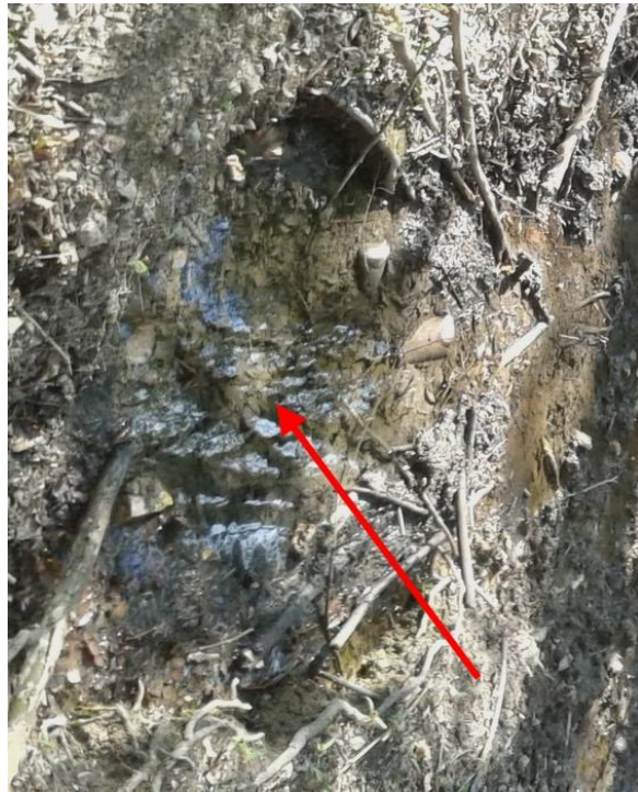
(Kristallklares Quellwasser dringt aus dem Boden)